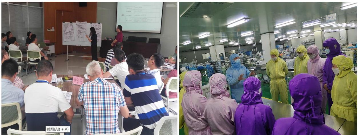
图 3.2-1 各类培训活动

公司将员工学习和发展视为“投资”，把创建学习型组织，营造全员学习的氛围作为公司长期发展战略的重要组成部分。随着公司规模扩大和全球化发展战略的实施，根据企业相关规定及各部门要求确定培训人员的需求情况。各部门负责人确定人员培训需求后经公司领导审批，相关部门每季度根据人员数量酌情进行培训计划的制定与实施。公司并成立了“海圣医疗商学院”，见图 3.2-1 所示。